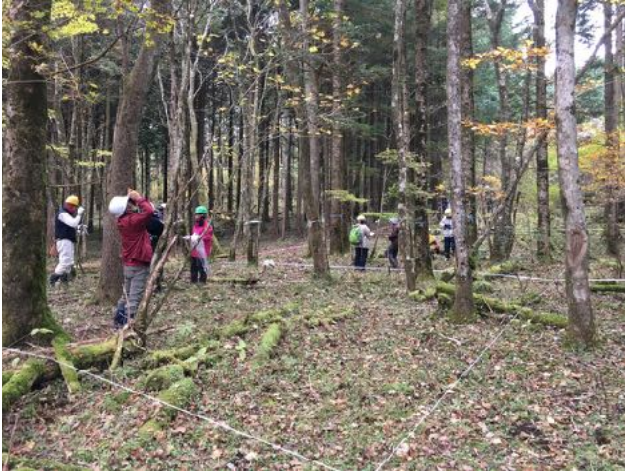
11/8 富士山クラブ協定林のウラジロモミ人工林の混交林化実験で、富士山クラブと協働で伐採予定部分の毎木調査を実施した。