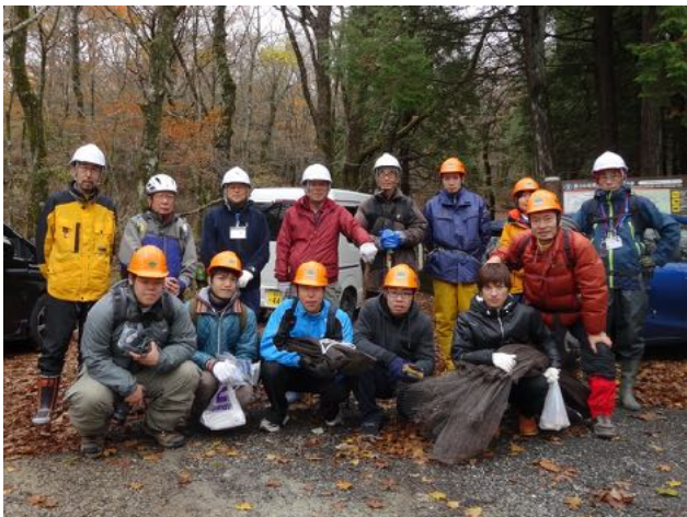
11/11 常葉大学と協働で須山口周辺の森で樹皮防護ネット(サブリガード)を設置した。