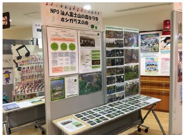
7/24～ 御殿場市市民活動支援センター主催のふらっと展に参加し、御殿場口の侵入植物などについてのパネルを展示した。