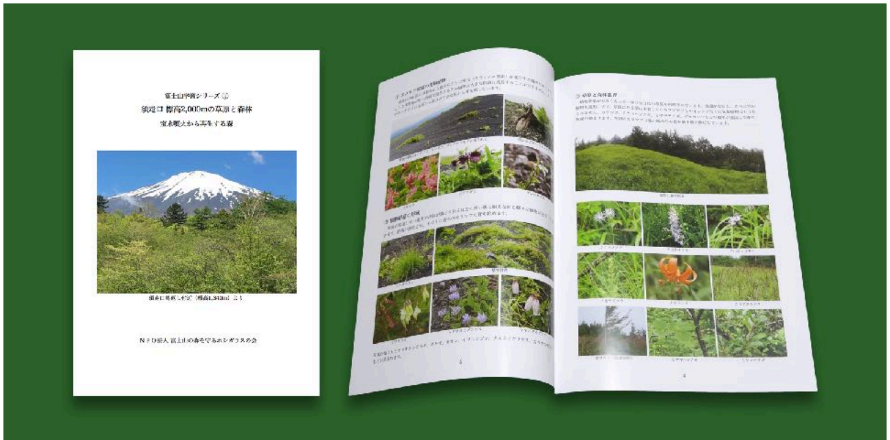
3月 高学年から教員向けの環境学習用冊子教員が現地で環境学習を行う際の参考となる内容となっている。