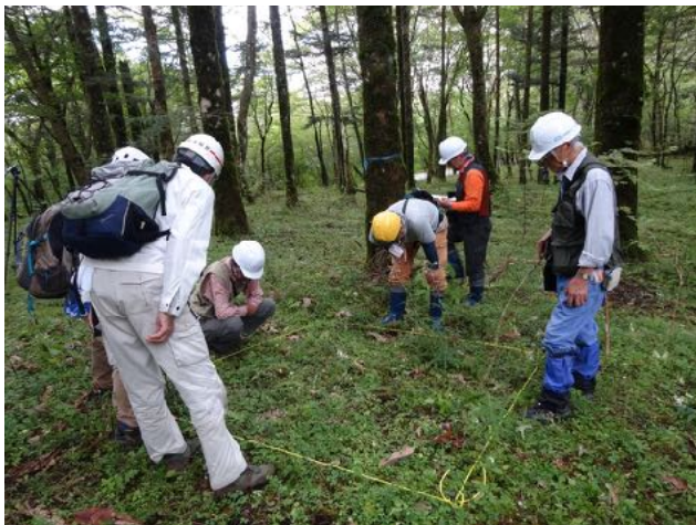
9/26 富士山クラブ西白塚協定林の混交林化実験で伐採前の植生調査を実施した。