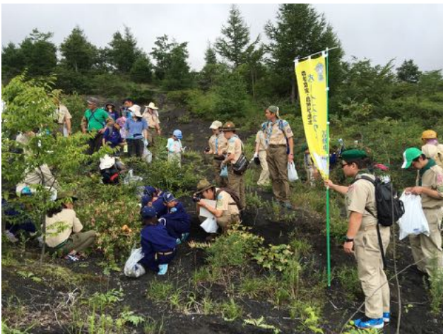
8/6 御殿場小山ボーイスカウトの外来植物・侵入植物駆除活動の指導を行った。活動は新聞報道された。