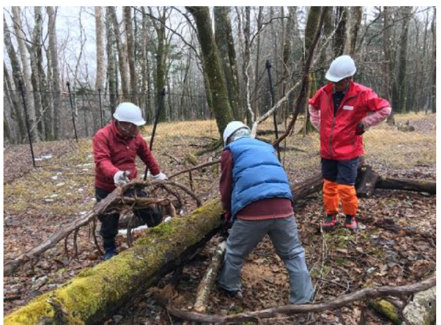
11/29 須山口に設置した植生防護柵の倒木を除去した。