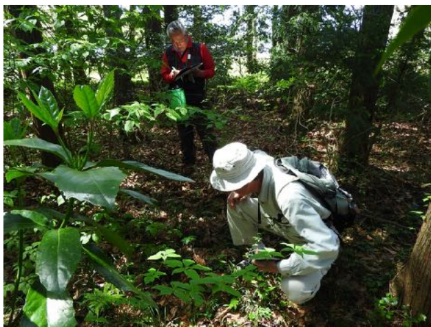
4/26～2/28 地元企業の生物多様性プロジェクトに協力。年間を通して植物と野鳥の調査を実施した。