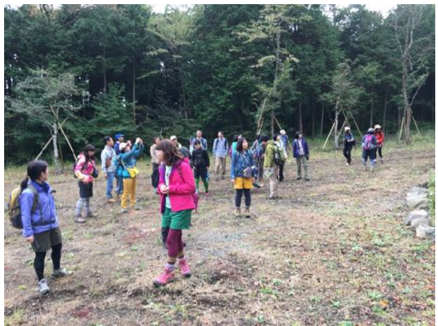
10/1,22 キリン・ランドネ主催「水をめぐる森の教室」で講師を務めた。