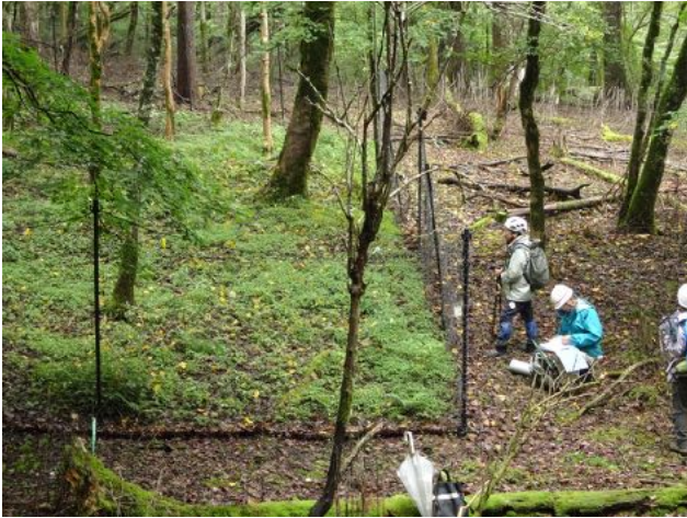
9/16 2013年秋に須山口周辺の森に設置した植生防護柵のコドラートによる調査を実施した。柵の内外の差が顕著に表れており、鹿の食圧の影響が深刻であることをあらためて確認した。