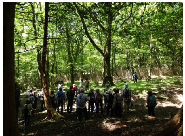
5/29 静岡県野鳥愛護協会主催の探鳥会で森の案内と植生防護柵の見学説明を行った。