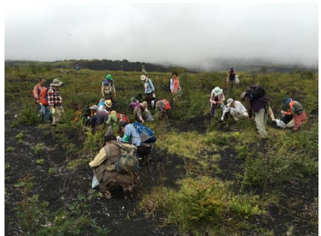
9/10 静岡県主催外来種駆除大作戦で自然観察会の講師と外来種駆除の指導を行った。