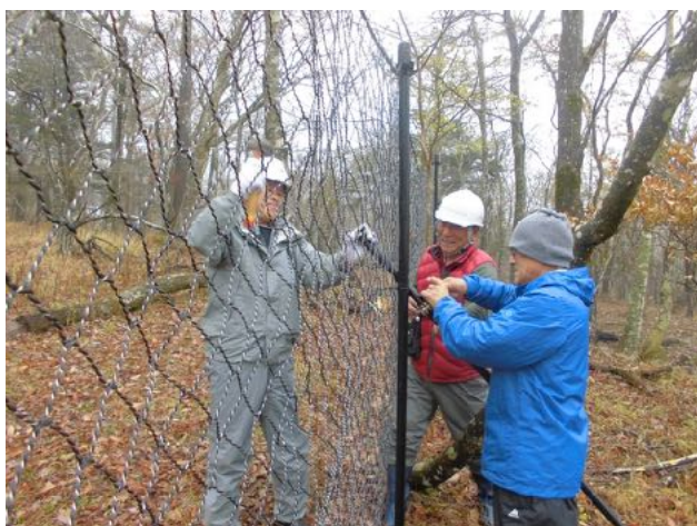
11/16 須走口に設置した植生防護柵の杭に支柱を設置した。