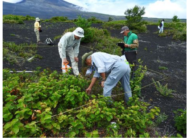
8/1 御殿場口雪代堆積地に5m×5mのコドラートを4箇所設定して植生調査を実施した。