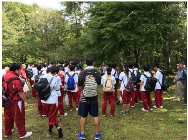
10/6 昨年に引き続き御殿場西高等学校の環境学習の講師を担当した。