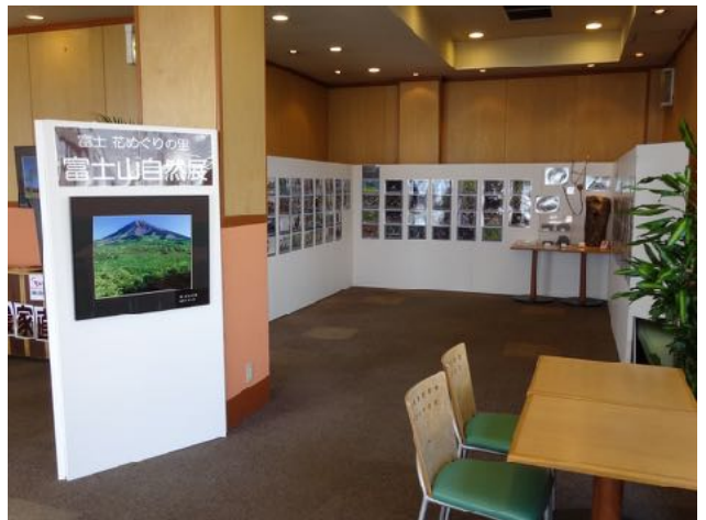
8月～9月 ぐりんぱ、2/23～ 小山町道の駅ふじおやま、3/5 須走富士山巡礼の道フォーラムでパネル展示を行った。