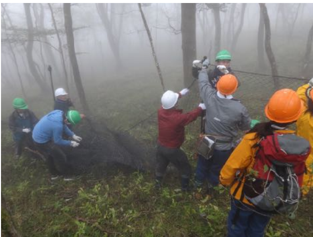
10/13 須走口馬返し付近の国有林に静岡森林管理署、常葉大学と協働で植生防護柵を設置した。