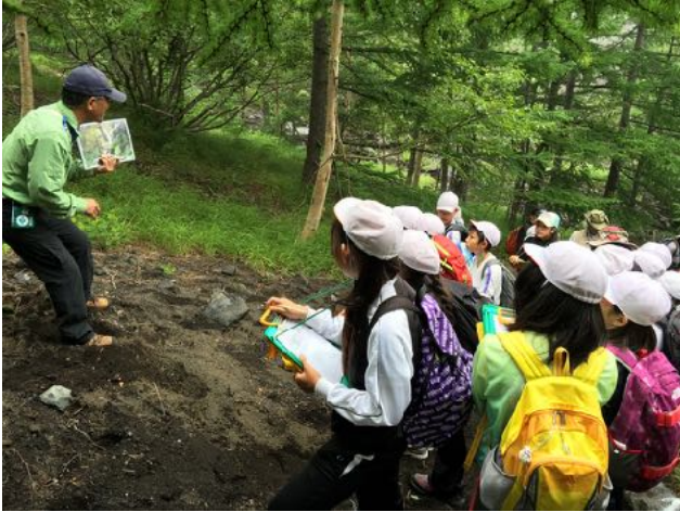
7/25 御殿場市立高根小学校の富士山学習に協力し、事前調査を行ない学習プログラムを作成、会員8名が講師を務めた。