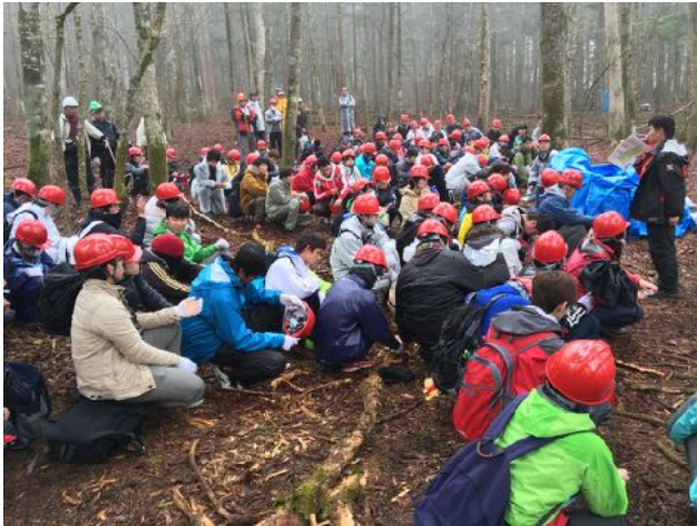
4/24 常葉大学新入生緑陰トーク&環境保全体験、静岡森林管理署と協働で支援し、森林についてのレクチャーと樹皮防護ネット掛けの指導を行った。