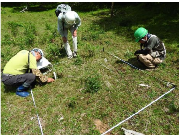
8/8 2015年秋に東白塚に設置した植生防護柵の中に3箇所、外に1箇所のコドラートを設定し、植生調査を行った。