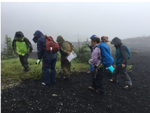
7/22 御殿場口火山荒原の自然植生観察と調査を実施した。