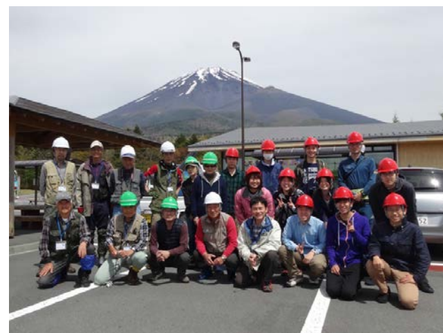
《2018年5月12日》常葉大学ビオトープ研究会の皆さんと植生保護柵の補修作業と森林の勉強会を実施。