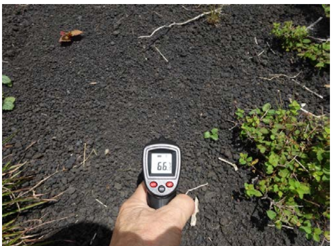
《2018年6月19日・8月27日・他》温度センサーロガーによる気温地表温度地中温度の連続調査・地表温度調査・土壌水分量調査・雨水成分調査などを実施。