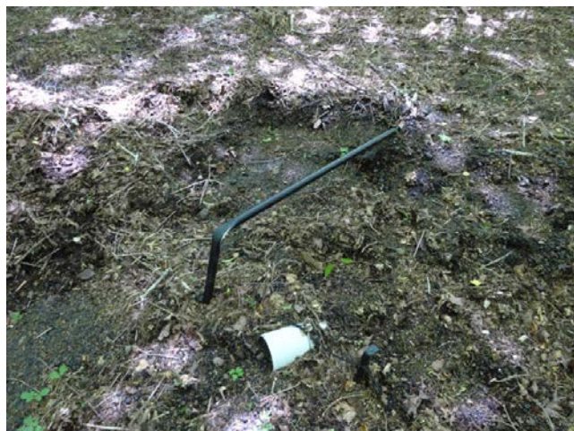
《2018年4月17日～》植生保護柵設置予定箇所の調査。植生保護柵の点検被害確認・周辺部の食害状況調査など。