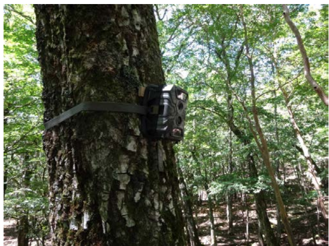
《2018年8月21日》植生保護柵の設置位置検討と動物調査用センサーカメラの設置。