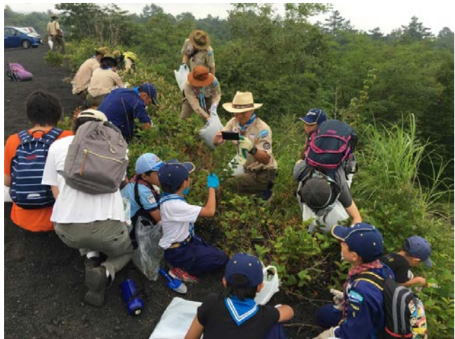
《018年8月4日》御殿場市交付金事業「ごてんばの富士山豆博士事業」として、観察ガイド「富士山御殿場口の自然観察」を作成。御殿場口の自然観察と侵入植物の駆除活動を実施。(観察ガイドはホームページで公開)