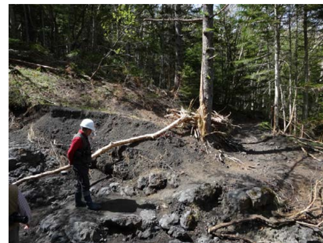
《2018年5月21日》小山町借受地の雪代被害調査、小富士遊歩道の森林の動物調査用カメラの設置場所の検討を実施。