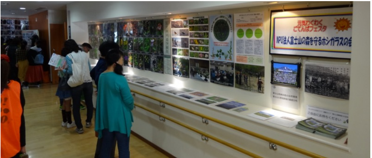
《2018年6月16～17日・8月25日～9月7日・10月28日》パネル展示による啓発活動 玉穂ふれあい文化展パネル展示・ふらっと展・元気わくわくぐてんばフェスタ2018。