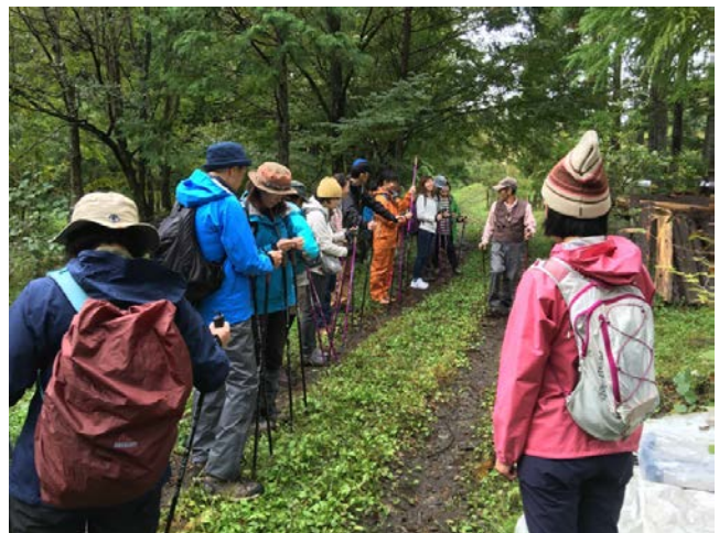
《2018年6月7日・10月14日》NPO土に帰る木・森づくりの会による目黒学院森林学習と、麒麟・ランドネ水を巡る森の教室で講師を担当。