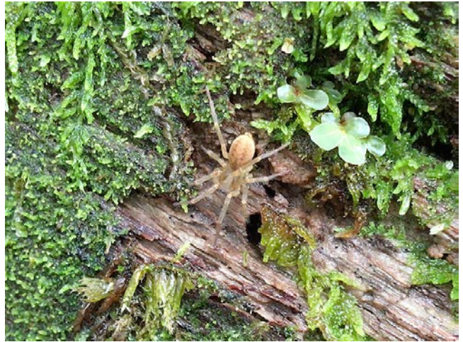
《2018年9月13日》環境指針となる蜘蛛に着目し、予備調査を実施。次年度より本格調査に入る予定。