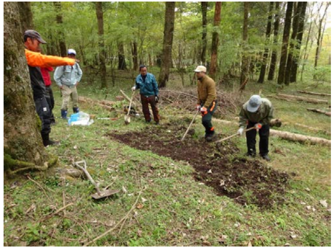
《2018年9月9日・9月11日・10月23日》試験地の現状調査と周辺のブナの実の状況調査・周辺天然林の観察(葉の大きさから遺伝子が異なると思われるブナの植栽を富士市区域で確認)・西白塚試験地・地掻きと苗づくり(NPO法人 富士山クラブ) これまでの活動および調査報告書の作成(ホームページで公開)