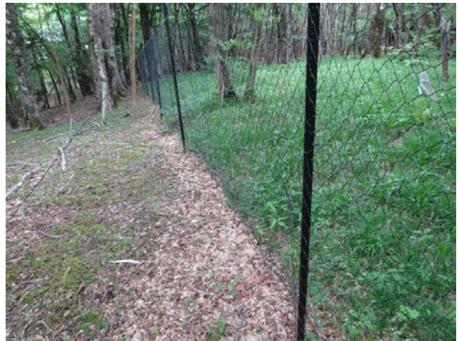
《2018年6月3日・10月11日・11月8日・12月7日》須山口周辺の植生保護柵点検・柵の点検とセンサーカメラの設置・柵内の樹木成長調査・東白塚草原の柵の支柱修理。