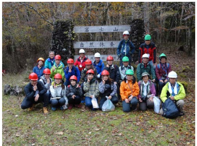
《2018年10月26日》静岡森林管理署、常葉大学の皆さんと協働で9基目の植生保護柵を設置。