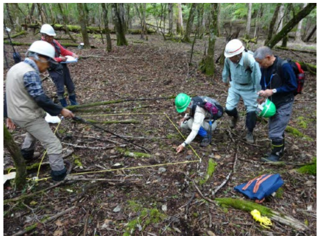
2019年10月7日 須山口植生保護柵の効果を確かめるための実生調査