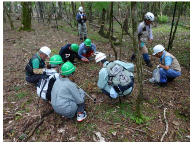
2019年9月2日 植生保護柵の毎木調査と植生調査(協働 常葉大学)