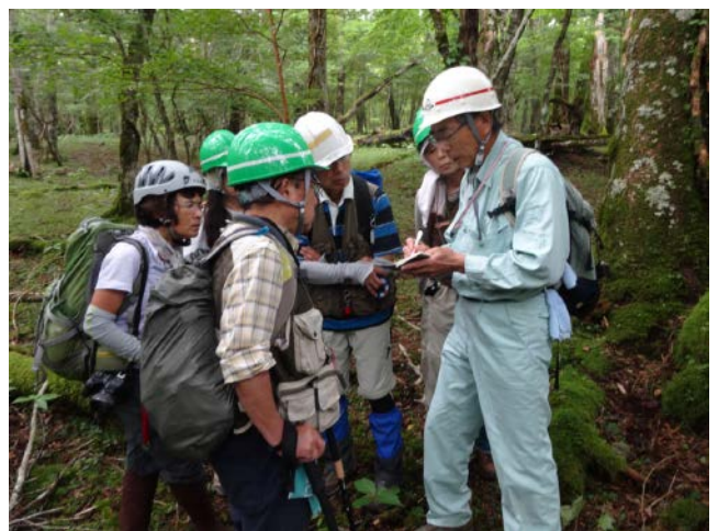
2019年8月31日 11年前の調査ルートを辿り同様の調査を実施