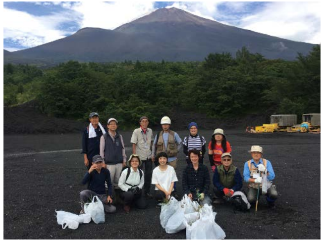
2019年4月28日 8月29日 御殿場口植生調査 外来植物・侵入植物駆除