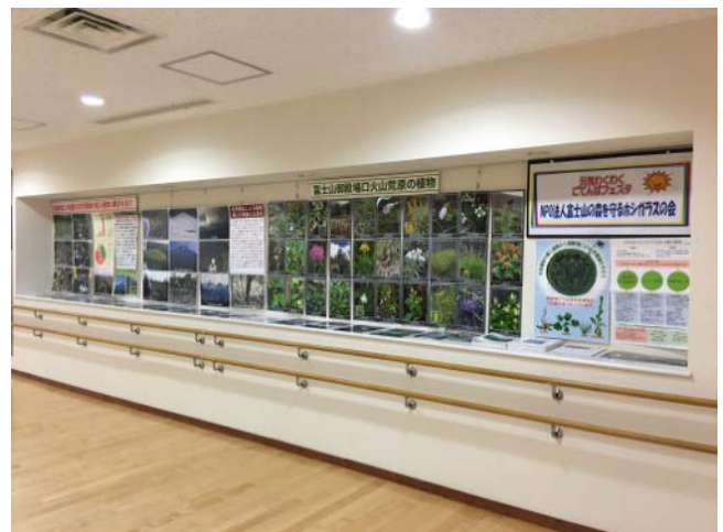
6/1(ecoまつり) 6/14～(玉穂ふれあい文化展) 8/20～(ふらっと展・ふじざくら) 10/27(元気わくわくごてんばフェスタ2017)