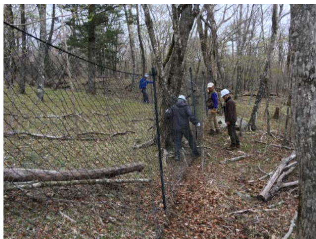
2019年5月7日 須走口の動物調査センサーカメラデータ回収と植生保護柵の点検