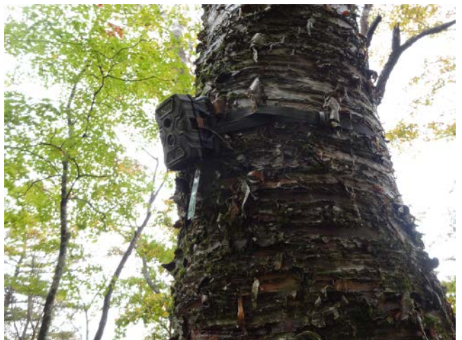
2019年10月20日 須走口の植生保護柵点検と動物調査センサーカメラ回収