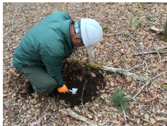
2019年5月9日 御殿場市区域の柵の点検と調査、動物調査センサーカメラデータ回収 土壌採取と分析