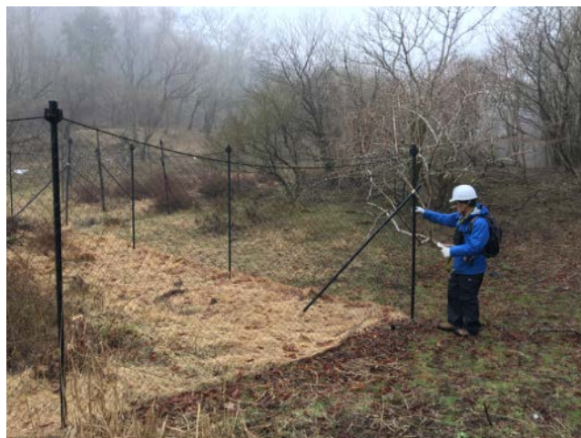
2019年4月29日 動物調査センサーカメラの回収と野鳥調査