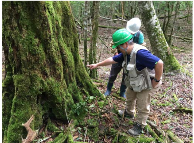
2019年9月14日 植生保護柵の効果を確かめるための蜘蛛調査