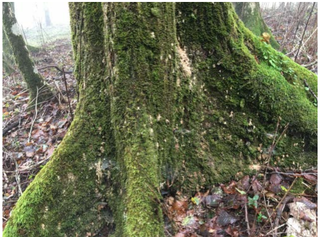
2019年10月16日 東白塚保護林への植生保護柵資材運搬ルート確認作業・ナラ枯れ調査