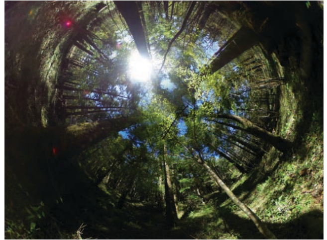
019年10月16日 ウラジロモミ人工林の混交林化実験・第2回植生調査 11月1日 全天写真撮影