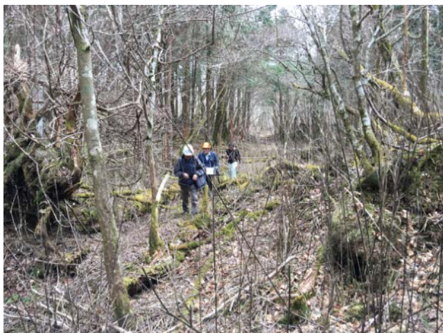
2019年4月19日 水ヶ塚遊歩道再開のための調査