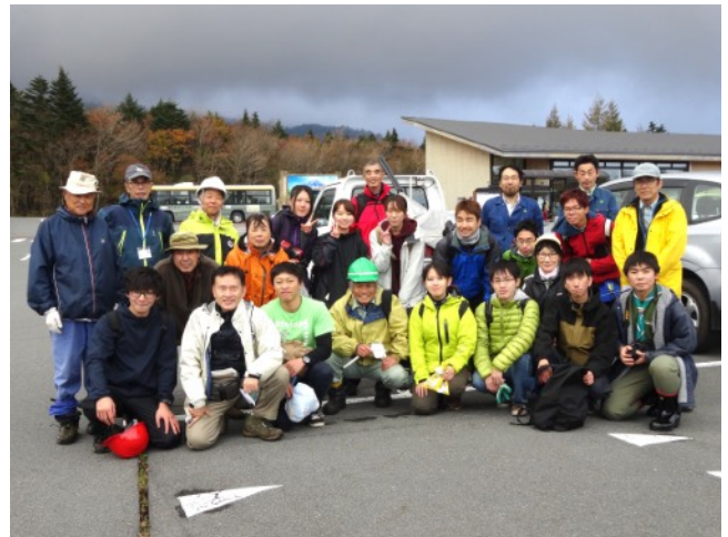
2019年11月4日 東白塚保護林に植生保護柵設置(協働常葉大学・ボーイスカウト)